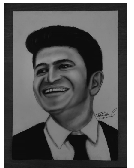
ಭರತ್ ಜಿ ದ್ವಿತೀಯ ಬಿಬಿಎ