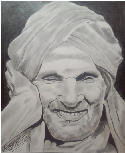
ಅನ್ವಿತ ದ್ವಿತೀಯ ಬಿ ಎ